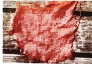
Abb. 3 v.l.: Leinen, Morinowolle, Shetlandwolle