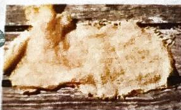
Abb. 3 v.l.: Leinen, Morinowolle, Shetlandwolle

Tauche während der Projektwoche ein in die Welt einheimischer Pflanzen. Einige davon können zum Färben von Textilien genutzt werden. Erkunde mit uns den botanischen Garten und lerne alles über Faser- und Färbepflanzen.